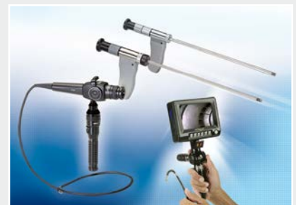
Technische Endoskopie, Lichtquellen