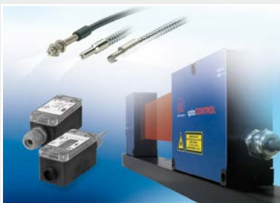
Optische Mikrometer, Lichtleiter, Mess- und Prüfverstärker