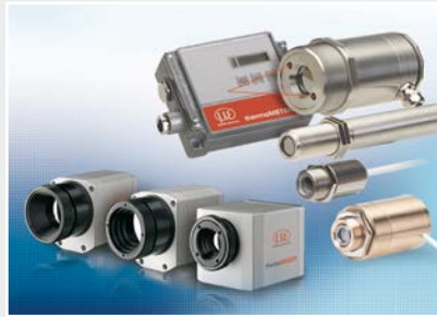
Sensoren und Messgeräte für berührungslose Temperaturmessung