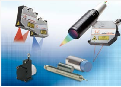
Sensoren und Systeme für Weg, Position und Dimension