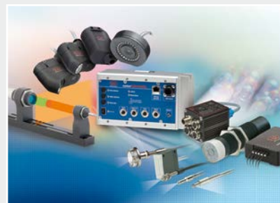
Sensoren zur Farberkennung, LED Analyser und Online-Farbspektrometer