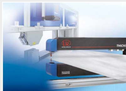
Installations de mesure et de contrôle pour l'assurance qualité