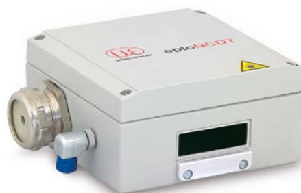
SGHx ILD taille S (140x140x71 mm) pour optoNCDT 1750 / 2300 dimensions 97x75 mm

Débit d'eau min. Q(\text{min}) = 3\text{ litres/min}