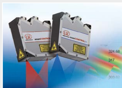
Capteurs de profil à ligne laser par triangulation 2D/3D