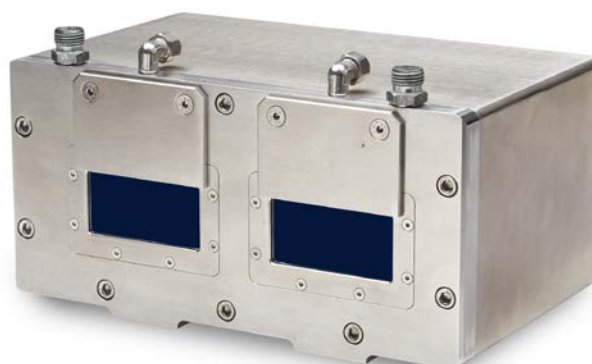
SGHx ILD taille M (140x180x71 mm) pour optoNCDT 1750 / 2300 dimensions 150x80 mm